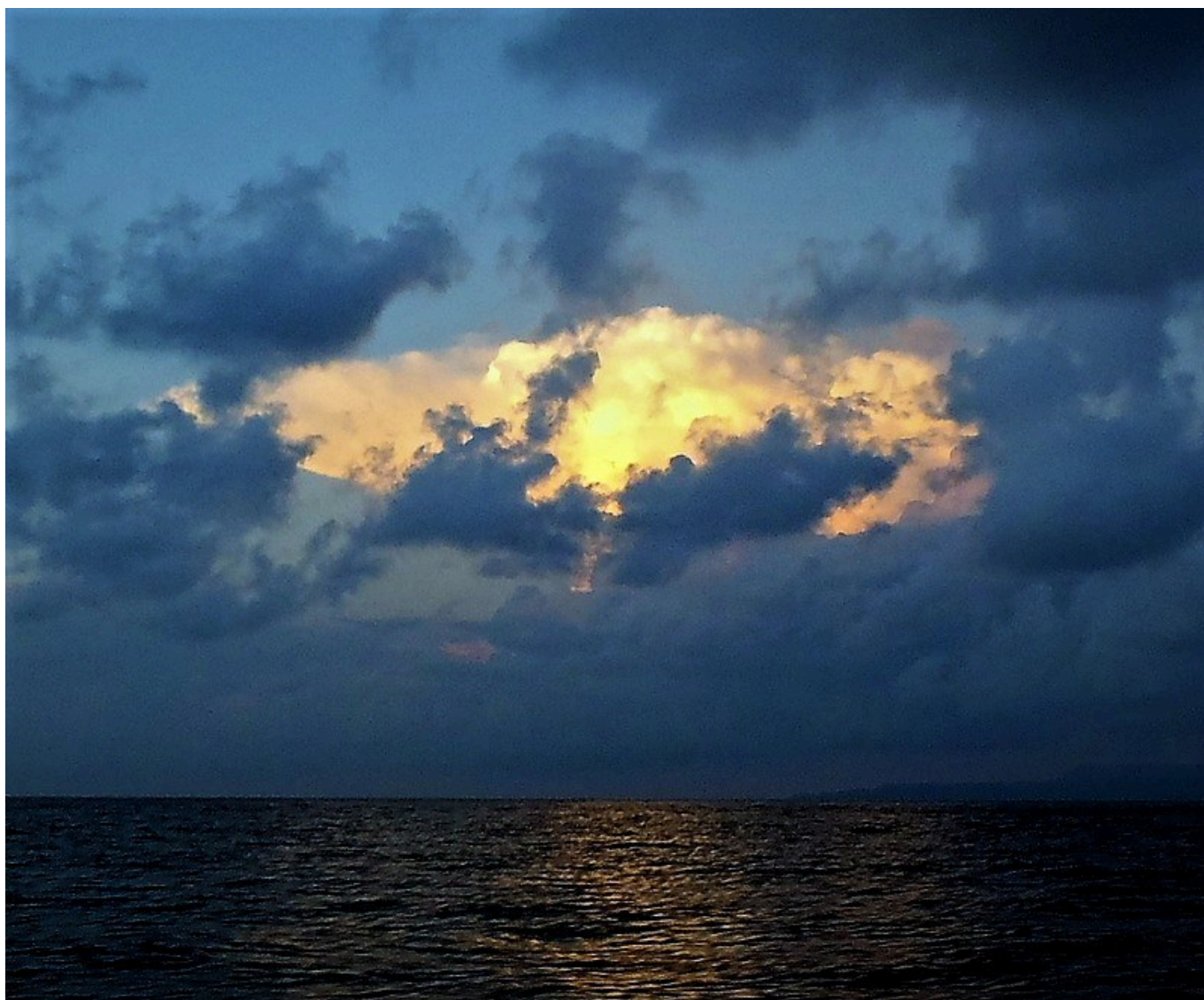
De goudenwolk, gelijk een atoombom