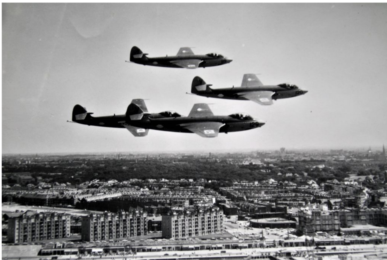
De Sealords boven Scheveningen