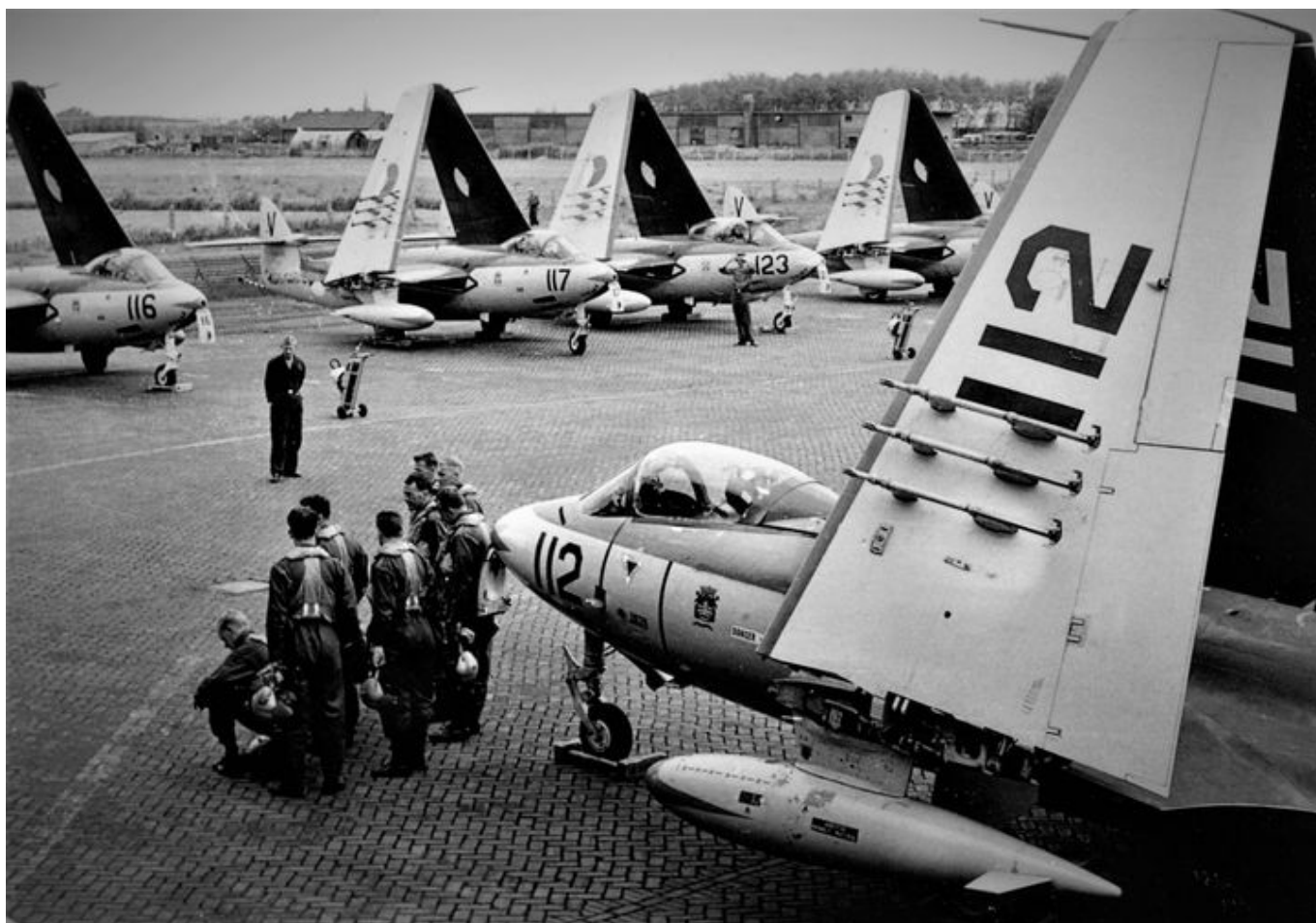
Ijzeren mannen met hun zoals ik al zei, raspaardjes.