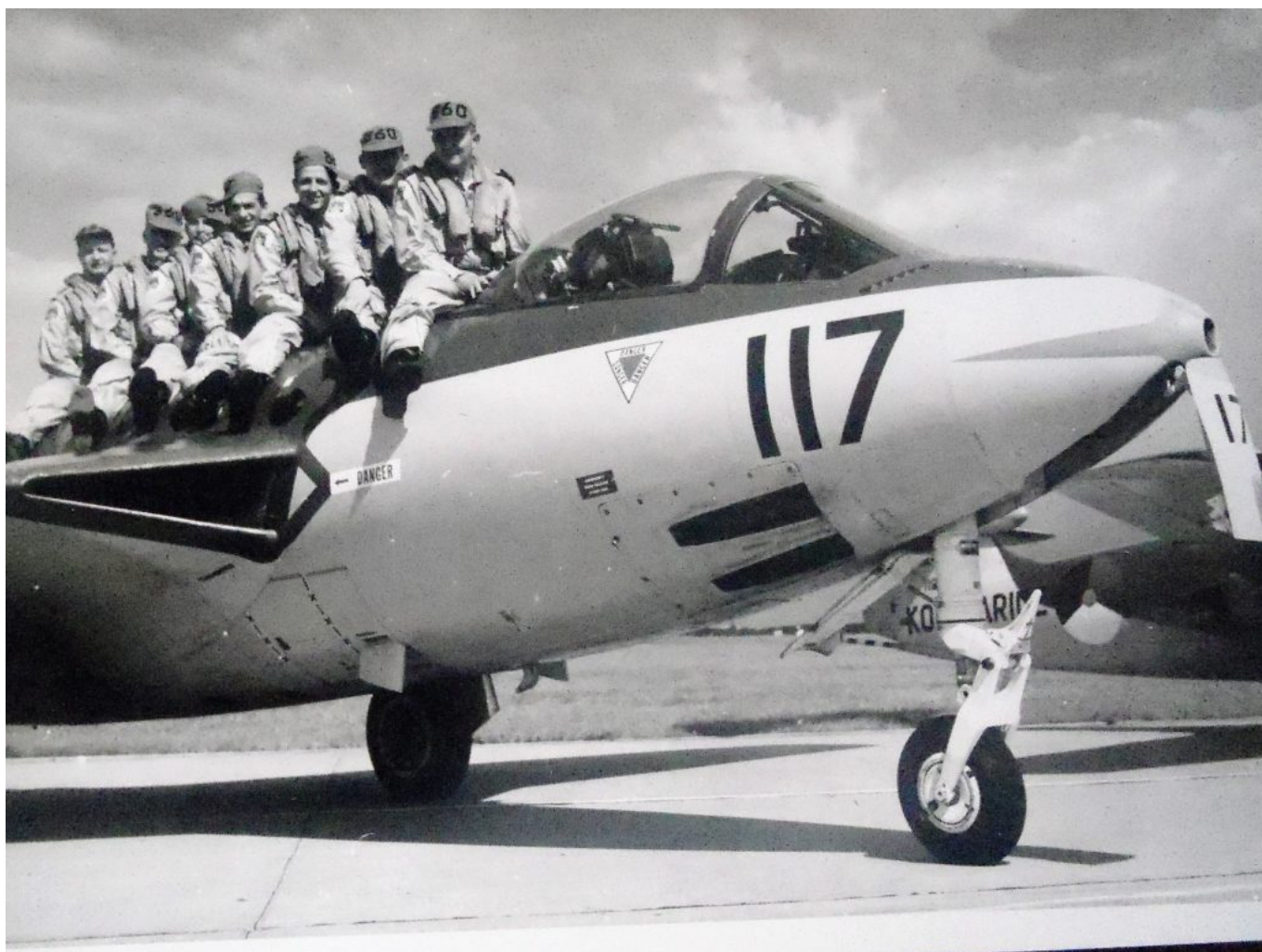
De mannen op hun raspaardje