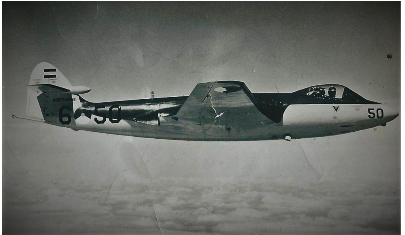
Seahawk nummer 50