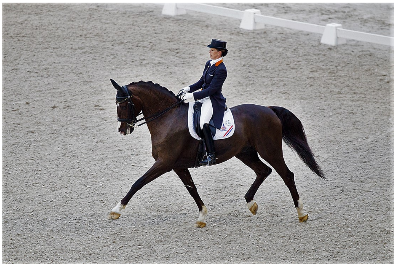
Anky met Bonfire